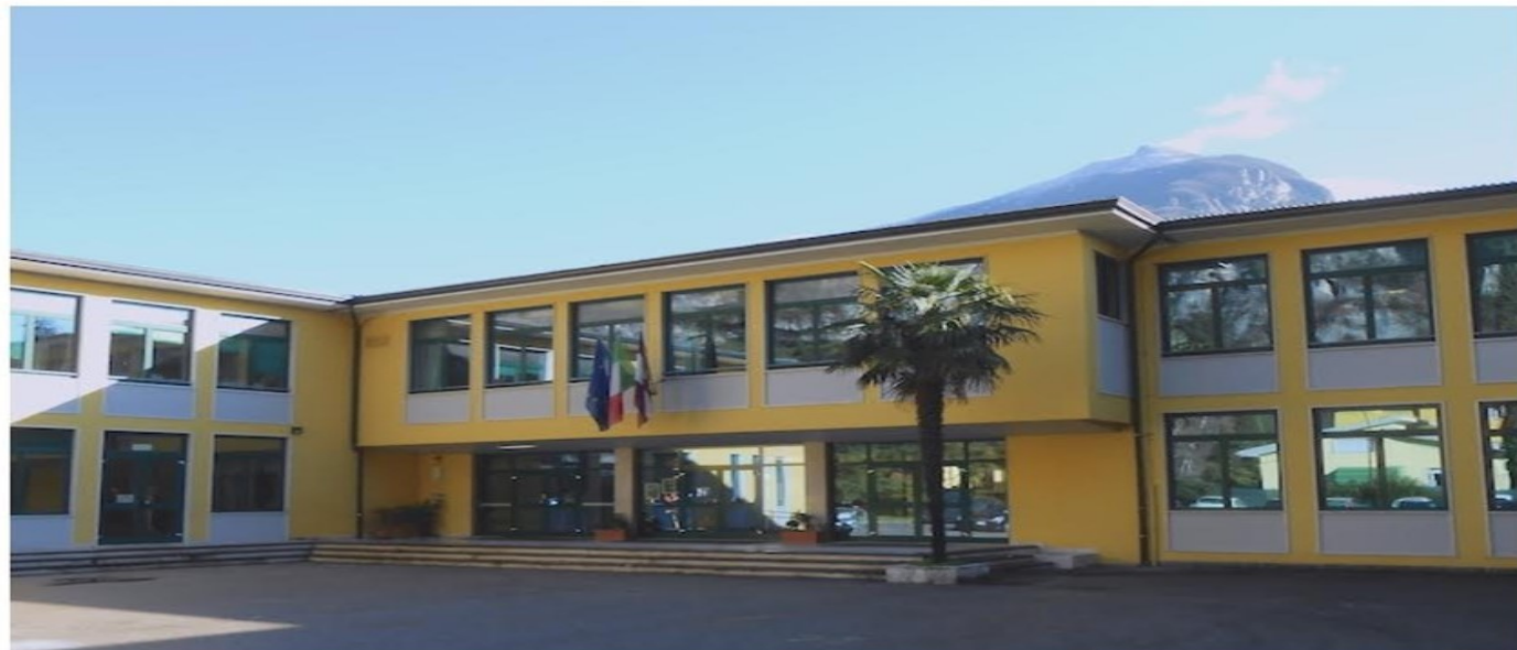
Scuola Secondaria di primo grado "Nicolò d'Arco" - Prabi